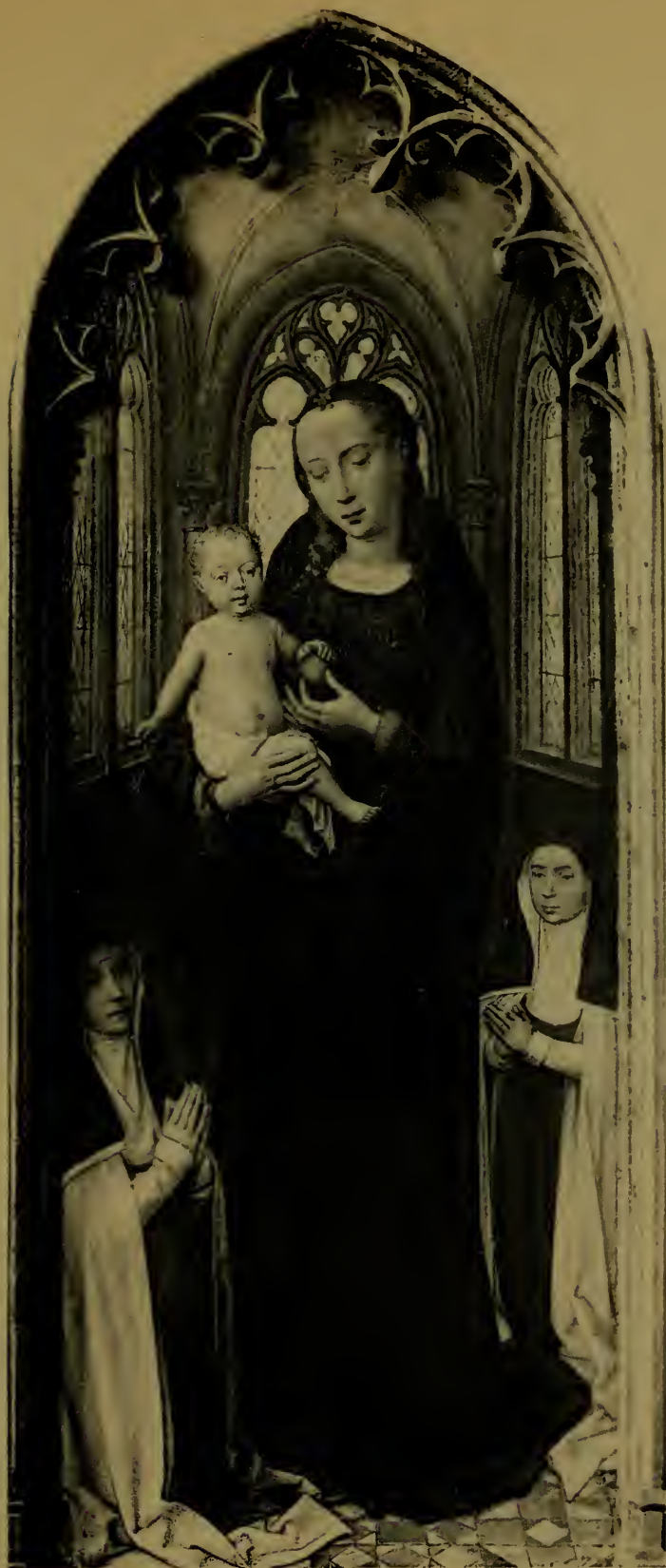
La Vierge & l'Enfant Jésus enseignant la vertu aux sœurs de l'hôpital Saint Jean, extrémité de la Châsse de Ste-Ursule.